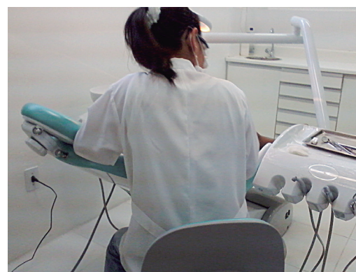
Atendimentos são de qualidade com profissionais altamente capacitados. VENHA CONFERIR!

OUTROS BENEFÍCIOS - Além do atendimento Jurídico e odontológico, temos parcerias com clínicas médicas, psicólogos, farmácias, faculdades, escolas de idiomas, escola de música e outros serviços. A lista completa você confere no menu de benefícios no topo do nosso site. Acesse www.sservidores.org.br