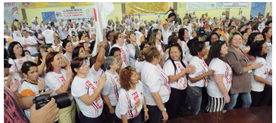
MULHERES da Fesspmesp e de outras entidades cobram mais espaço na Força