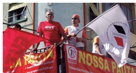
ESTIVEMOS na região de Itu