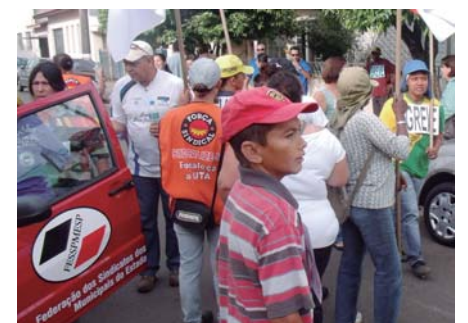
Ação conjunta entre Federação e Sindicato de Itirapina combate práticas antissindicais e consegue grande vitória

vido e atualizava o site (com fotos e vídeos) e as redes sociais praticamente em tempo real”, completa Bandeira.