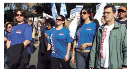
PARTICIPAMOS de ato em Americana