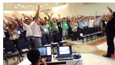
Houve muita interação e descontração

NA PRÁTICA - Entre os dias 15 e 16 de maio, mais de 80 dirigentes de Sindicatos do setor público se concen-