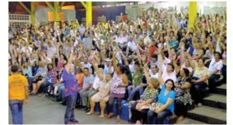
AINDA sem índice definido, funcionalismo de Marília pressiona administração