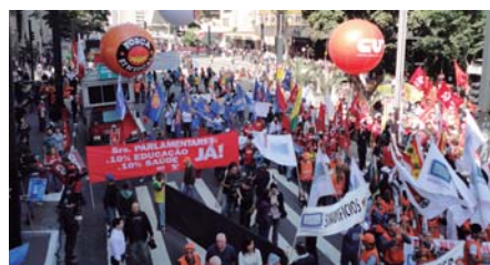
FESSPMESP presente na Capital

No documento, as lideranças exigem mais respeito e afirmam: "Exigimos mais atenção e respeito para com o funcionalismo público, responsável direto pelo bom funcionamento do Brasil".