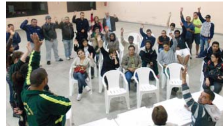
EM BOITUVA , Servidores conquistam 7%. Outros ganhos estão quase fechados