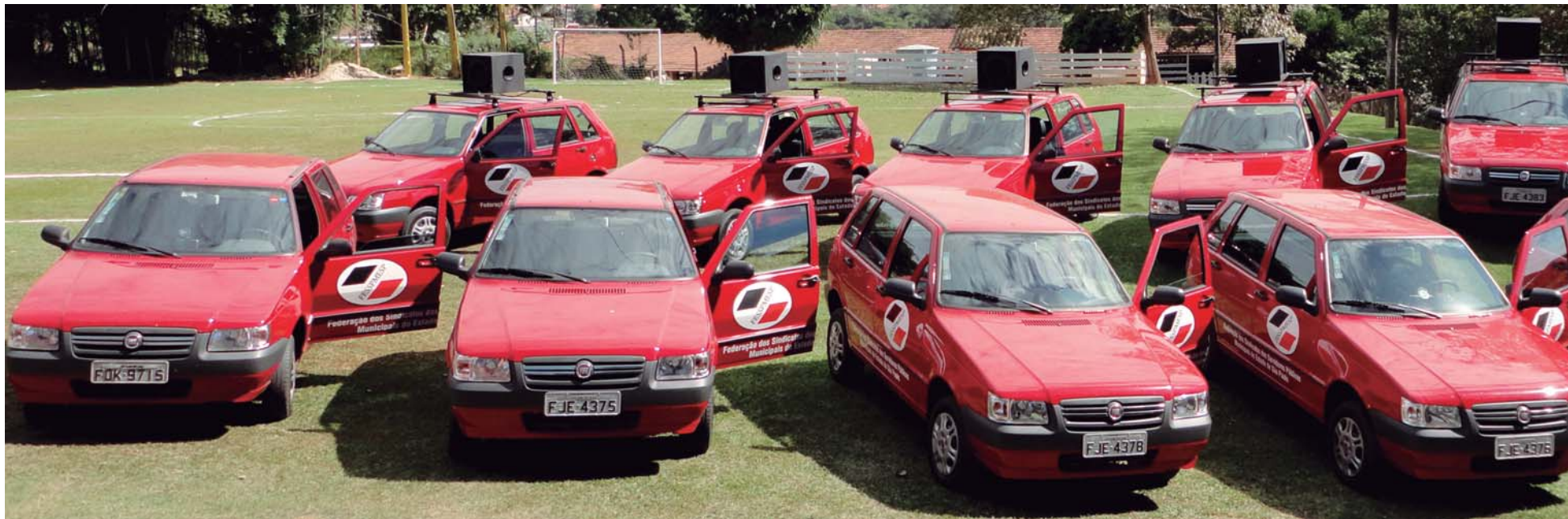
VEÍCULOS da Federação contemplam nossas 14 Regionais espalhadas por todo o estado de São Paulo. As “Viaturas Vermelhas” agilizaram ainda mais nosso atendimento

Promessa é dívida. E sabendo disso, nossa Federação cumpriu a que fez para os Sindicatos filiados em 2012.