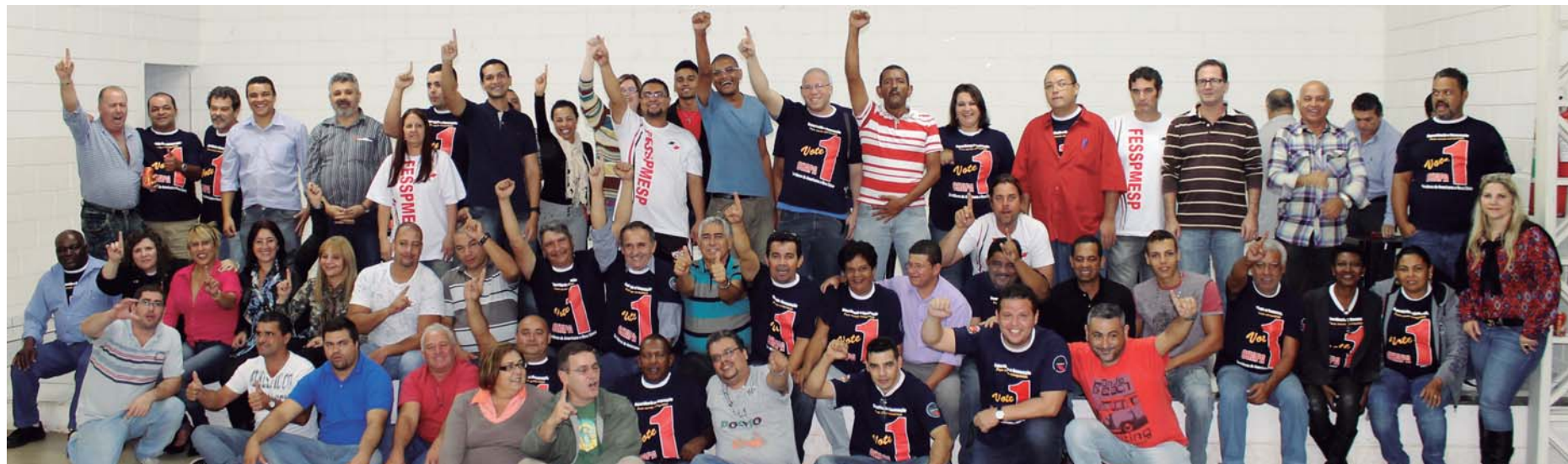
AMERICANA E NOVA ODESSA - Servidores votam em peso e elegem Chapa 1 - Experiência e Renovação para Novas Conquistas , com 97% dos votos válidos

Nos últimos meses, a Fesspmesp organizou muitas eleições sindicais. Entre elas, nas cidades de Campinas, Americana, Bebedouro, Guariba, Mogi das Cruzes, Peruíbe e Mococa. Em todas elas, saímos vitoriosos.