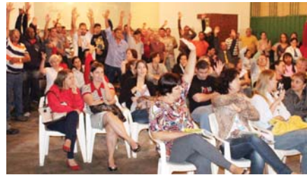
SERVIDORES lotam a sede do Sindicato de Espírito Santo do Pinhal