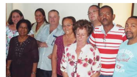
GUARIBA - Mais uma vitória da Federação; ao lado, BEBEDOURO em festa