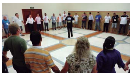
Companheiros durante apresentação

Nossa Federação sempre priorizou e atua na qualificação das lideranças ligadas à Fesspmesp. E, mais uma vez, cumprimos com o nosso compromisso.