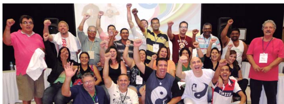
LIDERANÇAS ficaram satisfeitas com todo o ensinamento oferecido no curso

traram na Estância Santa Mônica para participar de um Curso de Formação. Foram mais de 24 horas de intensivas palestras e muita interação. O encontro foi excelente!