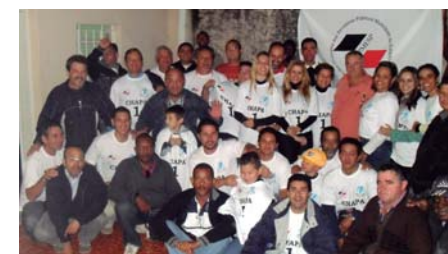
MOGI DAS CRUZES - Estivemos em peso; abaixo, MOCOCA : a união venceu

Mais informações, acesse nosso site www.fesspmesp.com.br ou ligue na Federação: (19) 3621.6176.