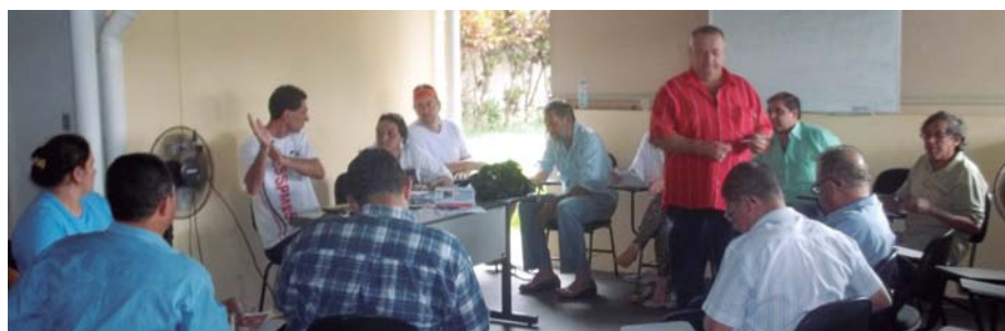
DIRIGENTES abordam pontos importantes dos próximos eventos da Fesspmesp